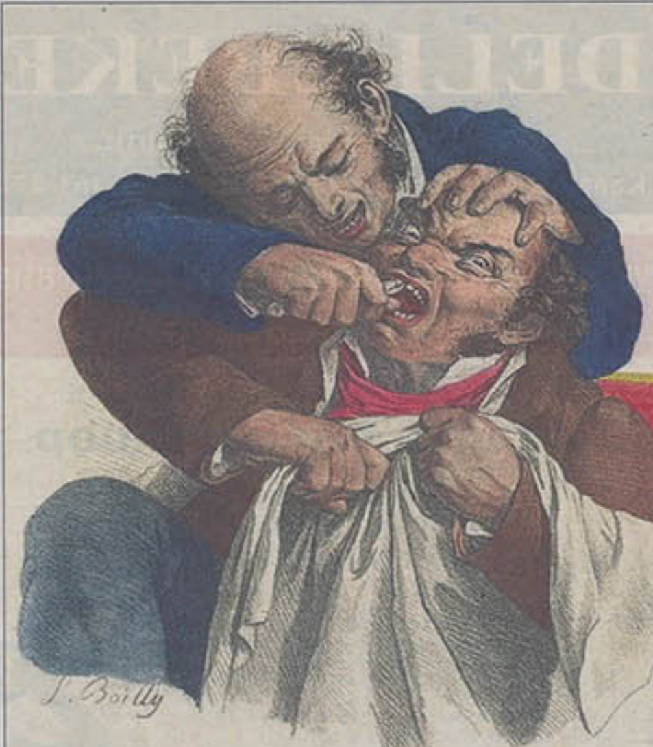
Een spotprint van een tandheilkundige aan het werk rond 1825.