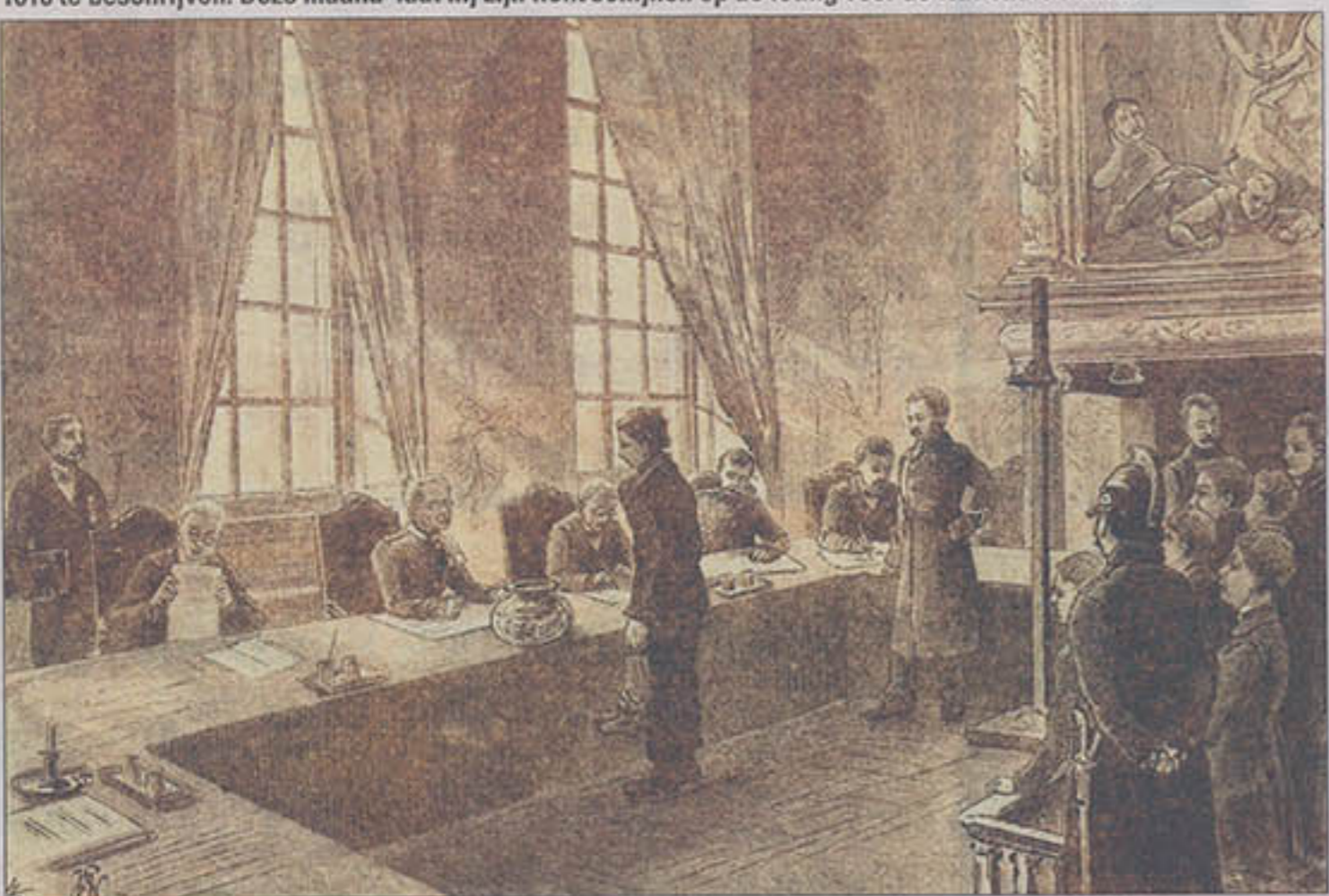
Voor de inwoners van Middelburg komt de bekendmaking van de loting voor de Nationale Militie in januari 1816 niet als een verrassing.

MIDDELBURG - 1816 is een woelig jaar in de geschiedenis van Nederland. Napoleon was net verslagen en onder leiding van Willem I moest het land opnieuw worden opgebouwd. Dat had zijn weerslag op het leven van de inwoners. Historicus Ruud Paesie stapt dit jaar elke maand twee eeuwen terug in de tijd om het leven op Walcheren in 1816 te beschrijven. Deze maand laat hij zijn licht schijnen op de loting voor de Nationale Militie.