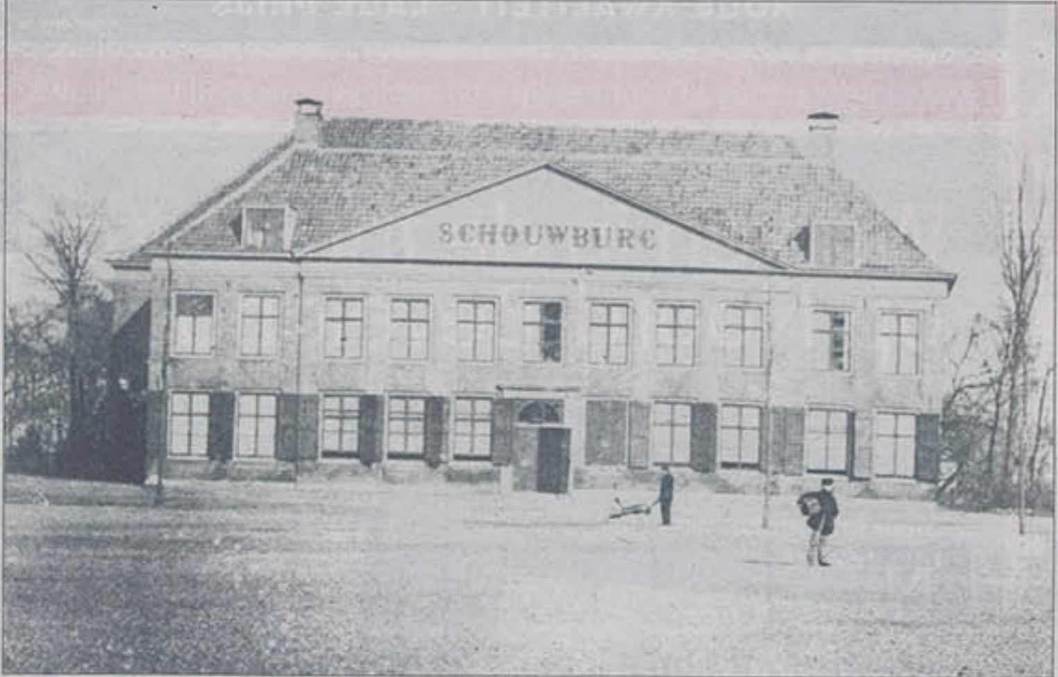
De schouwburg in Middelburg, die in 1807 verrees aan het Molenwater.