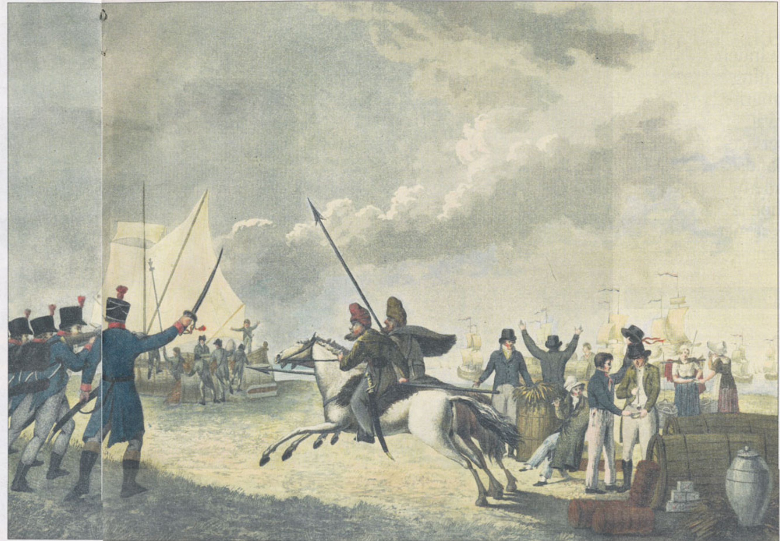
Spotprent op Franse douanen, 1813